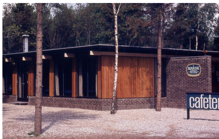
Sådan så Marsk Stig ud i 1978