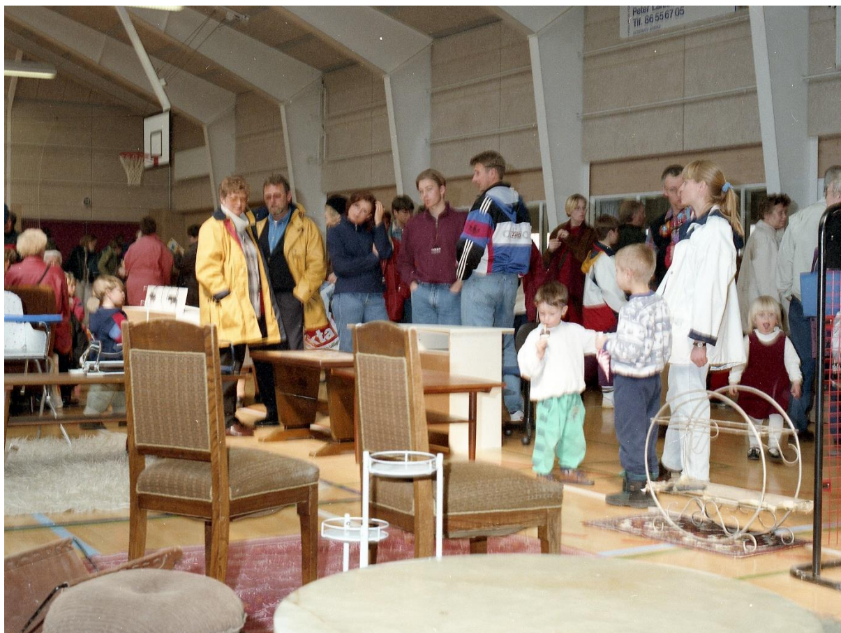
Loppemarked i Hou Hallen