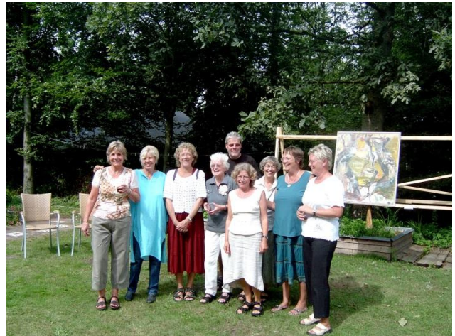
"Regnbuen", der står bag udstillingen