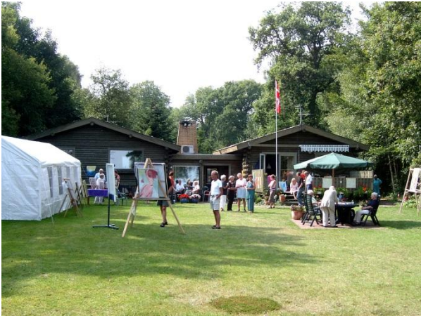
Maleriudstilling fra en have i Hou i 2006