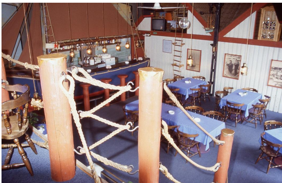
Udsigt fra balkonen i Skuden. Bemærk bardisken i hjørnet for neden. 2000

Restaurant Skuden åbnede i juni 1979 i Søndergade 19 i en del af de tidligere Hotel Hou. Efter andre ejere og formål vendte hotelbygningen tilbage til noget, der lignede det gamle spise- og udskænkingssteds formål. Restauranten blev indrettet i den gamle hotelsal. Som navnet angiver, er indretningen meget maritim med skibsmodel under loftet, tovværk, kobberlanterner over bordene og ikke mindst den halve sejlbåd, der fungerer som bardisk. I forbindelse med restauranten er der anlagt en gårdhave, hvor der er udeservering om sommeren. En hyggelig restaurant, der er samlingssted for såvel turister som lokalbefolkning året rundt.