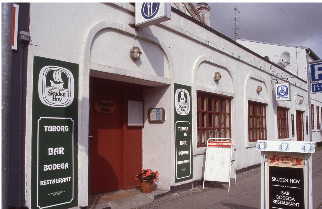
Skudens facade mod Søndergade. 2000

Restaurant Skuden åbnede i juni 1979 i Søndergade 19 i en del af de tidligere Hotel Hou. Efter andre ejere og formål vendte hotelbygningen tilbage til noget, der lignede det gamle spise- og udskænkingssteds formål. Restauranten blev indrettet i den gamle hotelsal. Som navnet angiver, er indretningen meget maritim med skibsmodel under loftet, tovværk, kobberlanterner over bordene og ikke mindst den halve sejlbåd, der fungerer som bardisk. I forbindelse med restauranten er der anlagt en gårdhave, hvor der er udeservering om sommeren. En hyggelig restaurant, der er samlingssted for såvel turister som lokalbefolkning året rundt.